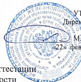
График промежуточной аттестации студентов специальности