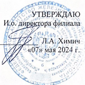
График промежуточной аттестации студентов специальности 23.02.06 Техническая эксплуатация подвижного состава железных дорог на 2-й семестр 2023/2024 учебного года.